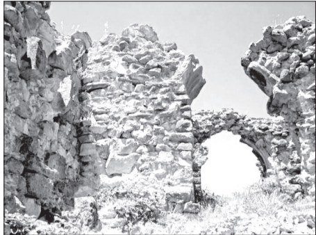
„არს მთის კალთას, სკანდას, სასახლე მეფეთა და ციხე დიდი, დიდშენი“ პასუხუტი პაპრატიონი