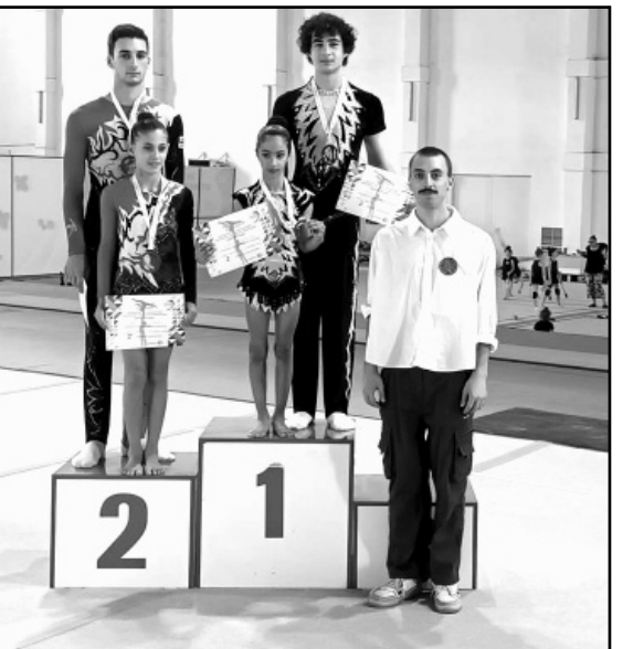
15-17 ივნისი. ქალაქი ბათუმი. საერთაშორისო ტურნირი ბ/რ წიდაობაში ჭაბუკთა შორის.