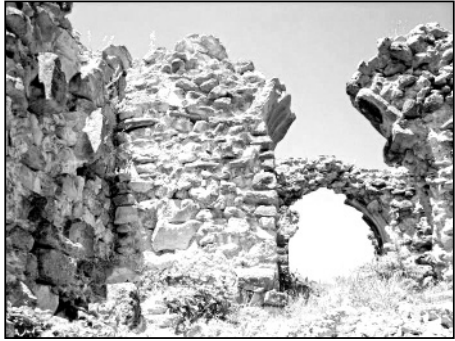
„არს მთის კალთას, სკანდას, სასახლე მფეფთა და ციხე დიდი, დიდშენი“ ვანუშუტი პაპრატიონი