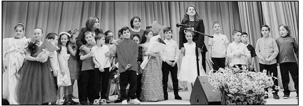
პედაგოგს, მშობლებს, მოსწავლეებს, დამსწრეთ, მოსწავლე-ახალგაზრდობის ცენტრის ხელმძღვანელს და თანამშრომ-