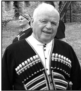
ცოცხლებო“, გვითხრა ბოლო თერჯოლობაზე...

„სიყვარულმა მომიყვანა, იმის სიხარულმა მომიყვანა ცოცხალი რომ ვარო და მოვალ ყოველ წელს, სანამ უფლის ნებით შევძლებ და ვი-