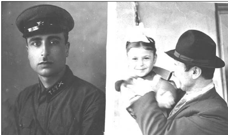
თბილისის საარტილერიო სასწავლებლის კურსანტი