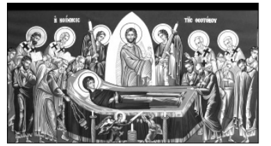
იყო მისი ქადაგება.

დასასრულს მეუფე გიორგიმ იქადაგა, დასამახსოვრებელი