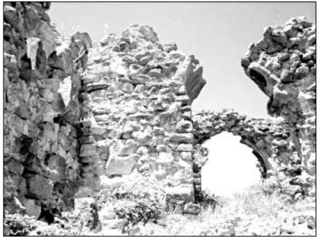
„არს მთის კალთას, სკანდას, სასახლე მეფეთა და ციხე დიდი, დიდშენი“ პანსუპტი პაპრატიონი